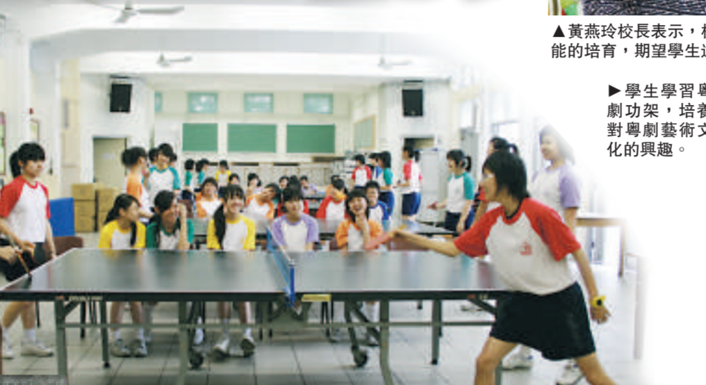
▲學生在學界體育運動比賽屢獲殊榮