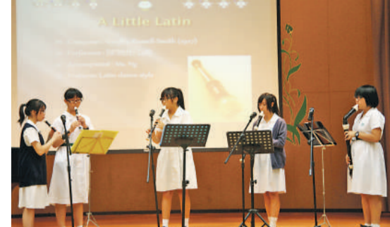
▲校內設有音樂隊，學生音樂才華出眾。