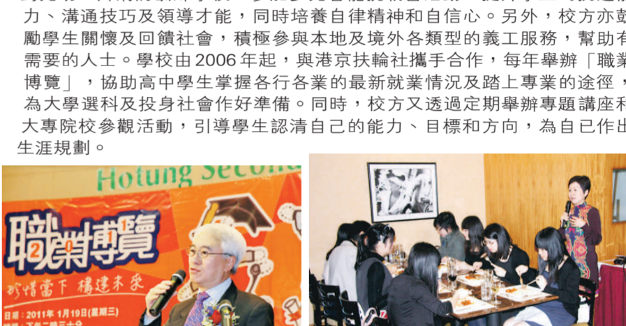
▲專家分享專業心得