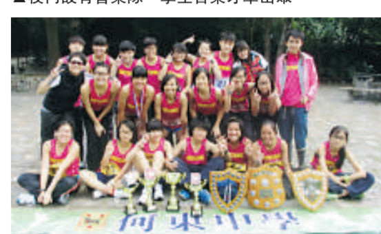
▲學生在學界體育運動比賽屢獲殊榮